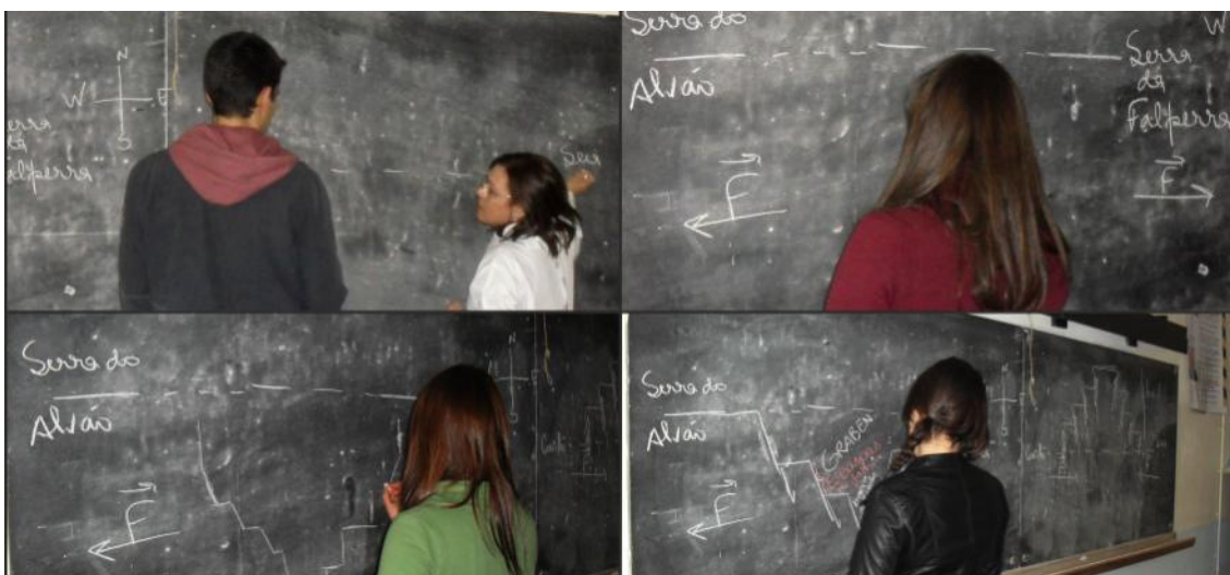
Imagem 3- Discussão na turma acerca de um modelo para um graben

As explicações produzidas pelos alunos foram discutidas no grupo turma. Posteriormente foi selecionada a explicação que constituiu a hipótese de investigação. Em discussão aberta e organizada foram comentados dois modelos teóricos concebidos por cada grupo, identificadas as suas limitações e registadas as devidas correções (Imagem 3).