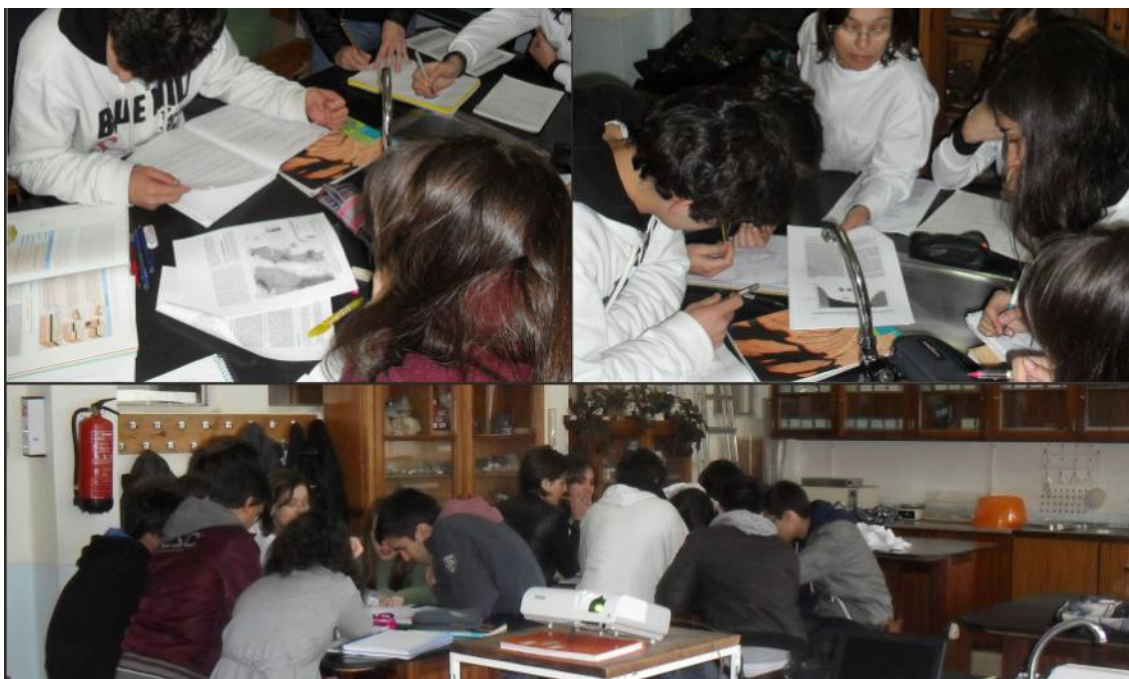
Imagem 1 - Alunos em atividade colaborativa

Para a implementação da metodologia ABRP os alunos foram distribuídos em grupos heterogéneos de 5 ou 6 elementos, de modo a maximizar o trabalho colaborativo e a partilhar aprendizagens à medida que iam concretizando as tarefas solicitadas (Imagem 1).