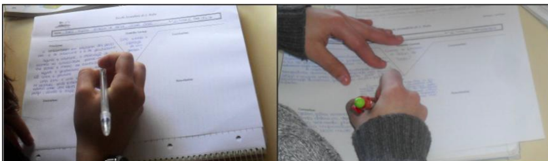
Imagem 5- Preenchimento individual do V de Gowin

No final da realização de cada uma das atividades experimentais procedeu-se à avaliação sumativa dos alunos, com o preenchimento de um diagrama em V (Imagem 5).