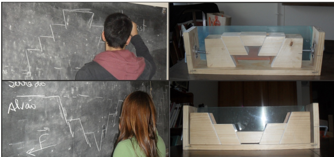
Imagem 4 - Conceção dos modelos pelos alunos e modelos elaborados e utilizados na experimentação

No final da realização de cada uma das atividades experimentais procedeu-se à avaliação sumativa dos alunos, com o preenchimento de um diagrama em V (Imagem 5).