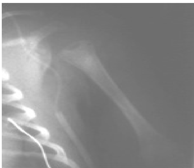
Figura 1 – Radiografia de face do ombro esquerdo evidenciando lesão osteolítica da metáfise proximal do úmero.

Caso 1 - Recém-nascido, 20 dias, sexo masculino. Antecedentes pessoais de prematuridade, sem internamento em cuidados intensivos. Cinco dias antes de recorrer ao médico assistente, iniciou diminuição da mobilidade do membro superior esquerdo, sem febre ou irritabilidade. Apresentava bom estado geral e membro superior esquerdo posicionado ao longo do corpo, em rotação interna, sem movimentos espontâneos e flácido. Evidenciava arreflexia total do bicípites, estilorrádial, e tricipital. O reflexo de Moro era assimétrico. A radiografia não mostrou alterações, não tendo efetuado outros exames. Diagnosticou-se “paralisia posicional”. Cinco dias depois mantinha o mesmo estado, evidenciando ainda sinais inflamatórios no joelho e pé direitos. Constatou-se paralisia flácida arreflexica do membro superior esquerdo associada a edema e eritema ligeiros desse ombro, também presentes no terço inferior da coxa e joelho contralaterais. A radiografia do ombro revelou lesão osteolítica da metáfise proximal do úmero esquerdo (Figura 1) e a radiografia do joelho revelou também uma irregularidade metafisária