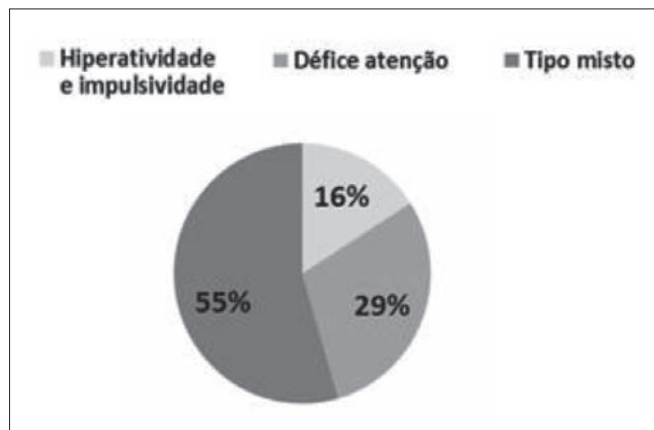
Figura 2. Sintomatologia

A referenciação à consulta de Pediatria de Desenvolvimento, em 44,5% das crianças foi realizada através da consulta de Pediatria Geral, em 24,4% pela consulta de Medicina Geral e Familiar, em 20 % dos doentes a via de referenciação foi variada, desde o serviço de urgência a outras consultas de especialidade, em 8,9% através de suspeita diagnóstica por psicólogos e em 2,2% através de educadores de infância. O motivo da consulta em 37,8% dos casos foi por dificuldades de aprendizagem, 35,5% por alterações do comportamento, 17,8% por défice de atenção, e em 8,9% das crianças pela associação de alterações do comportamento a dificuldades de aprendizagem. As Tabelas 1 e 2 revelam os antecedentes pessoais e familiares de interesse, relacionados com PHDA. Os sintomas predominantes referidos pelos pais/educadores e posteriormente avaliados através do preenchimento do questionário de Conners para pais e professores, permitiram diferenciar os subtipos clínicos (Figura 2). As co morbilidades identificadas estão apresentadas na Tabela 3.