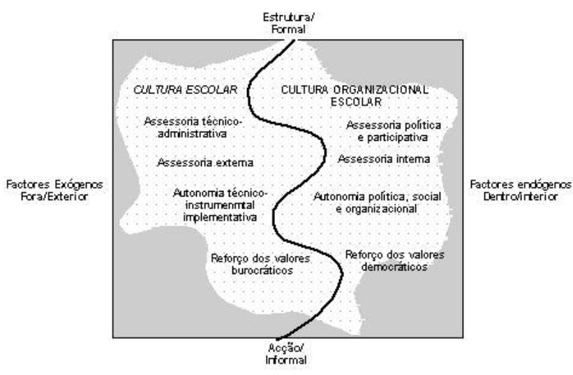
Figura 3 - Perspectivas de escola e funções da assessoria

mais democrática e autónoma, apresentamos graficamente a sinalização de duas concepções de escola antagónicas do ponto de vista político, organizacional e cultural. A primeira, situada no lado esquerdo da figura 3, pretende ilustrar uma imagem de escola relativamente cristalizada no imaginário colectivo, muito marcada pela ideia de reprodução burocrática do sistema central, um espaço que reflecte sobretudo uma cultura escolar institucionalizada, onde o centralismo e a uniformidade política, administrativa e pedagógica constituem o elemento mais marcante. Sobredeterminada exclusivamente pelos factores exógenos, esta imagem de escola articula-se com uma modalidade de assessoria de tipo externo e de cariz técnico e administrativo, centrada sobretudo no aprimoramento dos meios e das técnicas conducentes ao alcance dos resultados. Ressalta deste primeiro cenário uma assessoria centrada nos domínios mais instrumental e implementativo, aqueles que legitimam e reforçam os valores burocráticos do sistema.