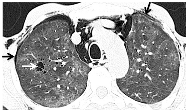
Figura 2 – TC torácico, imagem axial, janela pulmonar.