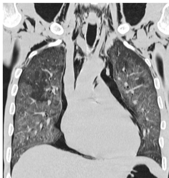
Figura 3 – TC torácico, imagem de reformatação coronal, janela pulmonar.