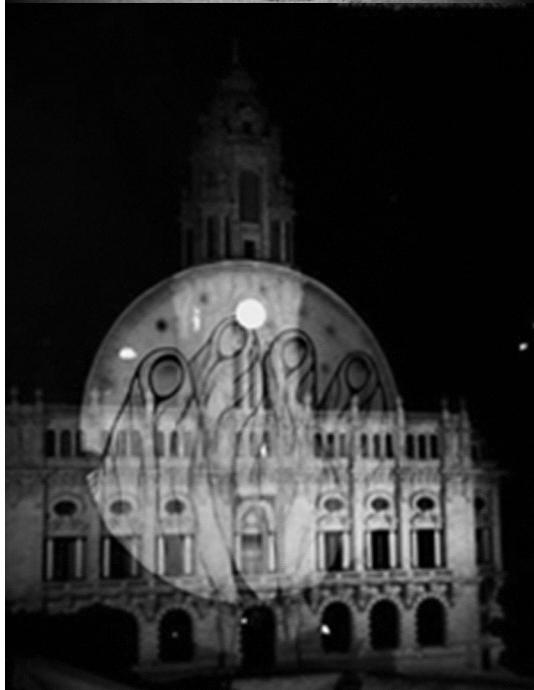
FIGURA 7 Inauguração do Street Art Axa Porto, obra de Hazul Luzah Foto: Egídio Santos, 2013.