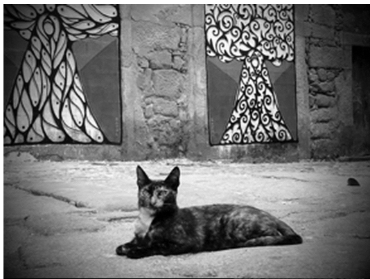
FIGURA 6 Obra de Hazul Luzah que tem um gato como curador Foto: Hazul Luzah, 2013.