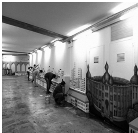
FIGURA 9 Artista realizando intervenção em túnel no bairro Alcântara Foto: Glória Diógenes, 2013.

No momento de entrevista, Slap apresenta uma intervenção efetuada num túnel em Alcântara, 42 que, sob sua supervisão, é pintado por vários artistas urbanos de Portugal, como se pode observar na fotografia abaixo. 43