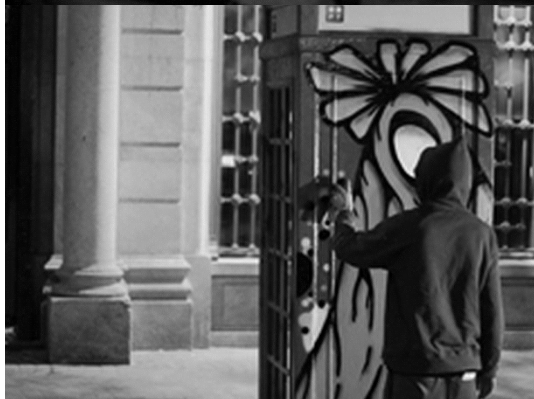
FIGURA 8 Intervenção artística em cabine telefónica na cidade do Porto