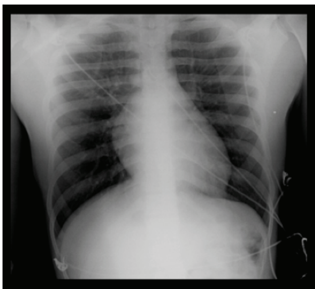
Figura 3 - Radiografia de tórax realizada 14 horas após o diagnóstico de EPPN, com melhoria do padrão radiológico de edema intersticial

Durante as primeiras horas manteve sinais vitais estáveis, em ventilação espontânea com oxigénio suplementar por máscara facial e registou-se melhoria gradual do quadro clínico. Às 12 horas de pós-operatório estava sem queixas e evidenciando melhoria clínica - auscultação pulmonar sem ruídos adventícios, oximetria de 98% (FiO 2 21%) e gasometria confirmando oxigenação e ventilação adequadas (Figura 3).