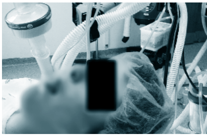
Figura 2 - Inserção de dispositivo supraglótico

No dia da cirurgia, após a chegada ao Bloco Operatório, o doente foi monitorizado de acordo com os standards da American Society of Anesthesiologists (ASA) e, ainda acordado, foi puncionado para colocação de um acesso intravenoso de calibre 22 gauge no membro superior direito, procedimento que decorreu sem menção de dor. A anestesia foi posteriormente induzida com 0,05 mg de fentanil e 90 mg de propofol intravenosos e a via aérea assegurada através da colocação do dispositivo supraglótico i-gel® 2,5 (Fig. 2), sem que o doente apresentasse variação dos seus parâmetros hemodinâmicos.