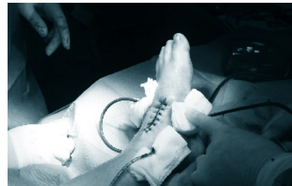
Figura 4 - Final da Cirurgia

-Anestésicos onde nenhuma complicação foi reportada (Fig. 4).