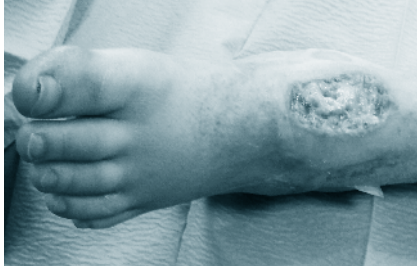
Figura 1 - Ferida infectada no tornozelo

Antecedentes pessoais de ICDA, talassémia menor, distúrbio de défice de atenção e hiperatividade (DDAH) e um “suposto” quadro de hipertermia maligna (HM) em internamento prévio. História de alergia conhecida ao Vicryl®. Medicado, habitualmente, com metilfenidato.