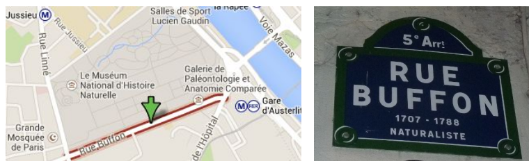
La Rue Buffon.

Havia planos para esta rua desempenhar um papel importante em Novembro de 2013, como parte de uma acção para a divulgação da Matemática. A Comissão RPA (“Raising Public Awareness”) da European Mathematical Society (EMS) reuniu-se nesse mês em Paris, e surgiu a ideia de “reconstituir” a experiência de Buffon, simbolicamente, na própria Rue Buffon. As condições não podiam ser mais propícias: a Matemática correspondente pode ser facilmente compreendida por um público leigo – não sendo, por outro lado, completamente trivial – e, com contactos apropriados e alguma preparação profissional, seria razoável esperar uma boa cobertura mediática, realizando assim uma acção significativa para a divulgação da Matemática.