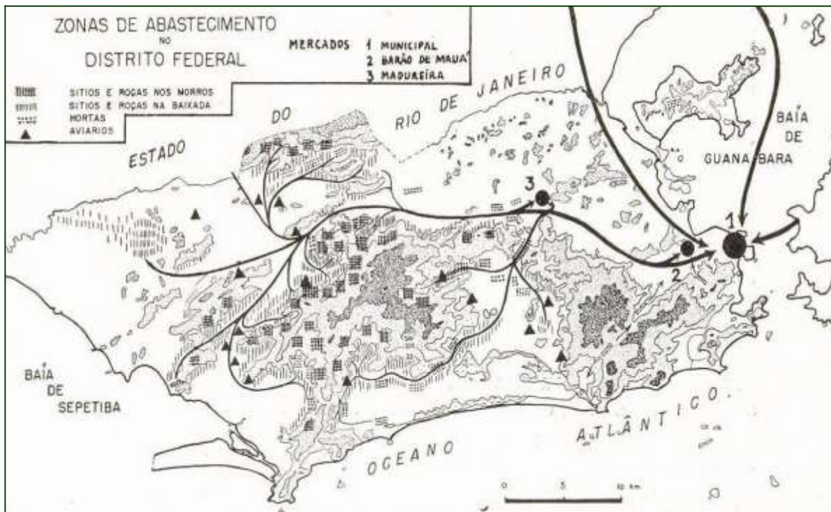
Figura 2. Zonas de abastecimento de hortifrutigranjeiros da cidade do Rio de Janeiro

O mapa abaixo, de 1957, quando a cidade era ainda Distrito Federal (capital do país), mostra como a agricultura de base familiar concentrou-se em morros e baixadas, até então áreas menos ocupadas da Zona Oeste do Rio de Janeiro. No alto identifica-se o Maciço de Gericinó-Mendanha, abaixo o Maciço da Pedra Branca e à direita, o Maciço da Tijuca 10 . Pode-se observar também, pela localização dos mercados, que essa agricultura possuía escala para o abastecimento da cidade.