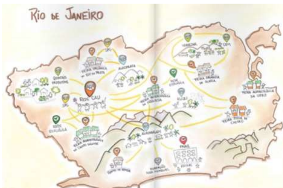
Figura 3. Fluxos entre mercados agroecológicos, organizações de agricultores e consumidores na cidade do Rio de Janeiro

Fonte: AS-PTA, Revista Territórios da Agricultura Familiar na Região Metropolitana do Rio de Janeiro, 16 de setembro 2015, Disponível em: http://aspta.org.br/205/10/territorios-da-agricultura-familiar-na-regiao-metropolitana-do-rio-de-janeiro/ , acesso em 27 de setembro de 2015 Sylvio Froes Abreu, 1957.