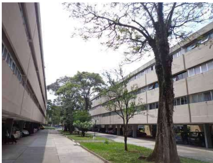
Figura 11. Conjunto CECAP Guarulhos, projeto dos arquitetos João Vilanova Artigas, Fábio Penteadó, Paulo Mendes da Rocha, construído em 1967

Conjuntos semelhantes aos realizados sob o BNH e PMCMV na sua modalidade Empresas continuam sendo construídos pela Companhia de Desenvolvimento Habitacional e Urbano (CDHU) do Estado de São Paulo, ainda que com esforços renovados no sentido de maior qualidade da construção e com adoção de técnicas de redução de consumo energético e produção de energia de fontes alternativas. Curiosamente, a origem do CDHU foi a CECAP (Caixa Estadual de Casas para o Povo), através da qual se produziu um dos conjuntos habitacionais emblemáticos da Arquitetura moderna em São Paulo, o CECAP Guarulhos, projeto de equipe coordenada pelo arquiteto João Vilanova Artigas (Figura 11).