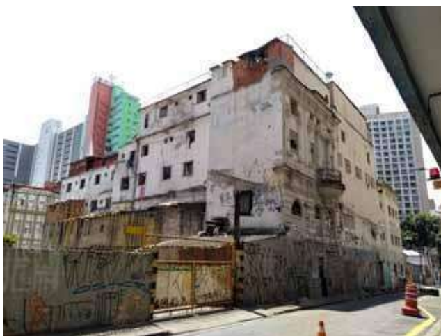
Figura 4. Ocupação Rio Branco

Nota: Conjunto ocupado no centro paulistano por movimentos de moradia do Movimento Sem Teto do Centro, ligados à Frente de Luta por Moradia