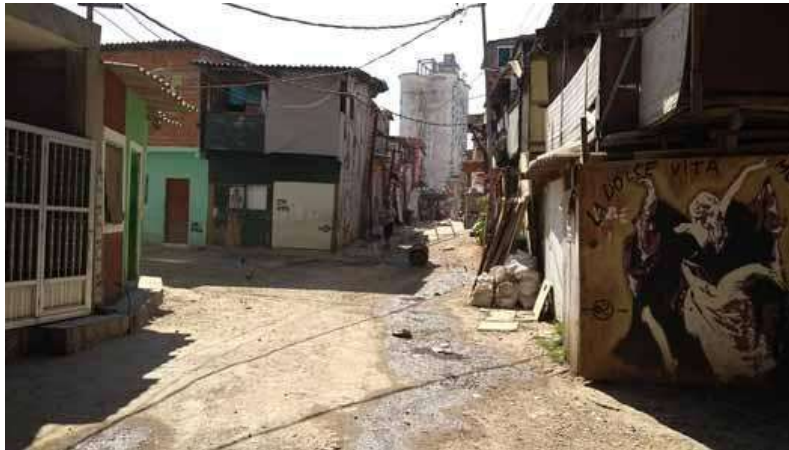
Figura 6. Favela do Moinho, na área central paulistana