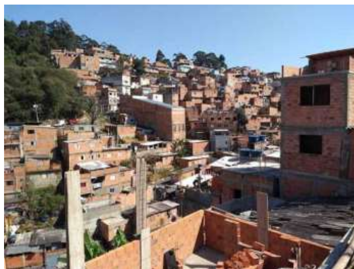
Figura 5. Jardim Paraná, bairro popular na zona norte de São Paulo

Carolina de Jesus, no seu diário cujo fragmento está acima reproduzido, refere-se às favelas paulistanas da década de 1950. O contraste entre elas e os bairros ditos formais mantém-se, ainda que atualmente as favelas em São Paulo apresentem construções em alvenaria, em que tijolos cerâmicos são assentados com argamassa de cimento, e também em lajes compostas por vigotas de cimento armado entremeadas de tijolos cerâmicos. Não é comum a utilização de telhados sobre as lajes de cobertura. Habitualmente, estas lajes são base para futuras ampliações, quando filhos ou parentes ali constroem as suas moradias. Também são utilizados pilares de betão com função estabilizadora, de travamento, além de ajudar na resistência das paredes (Figura 5).