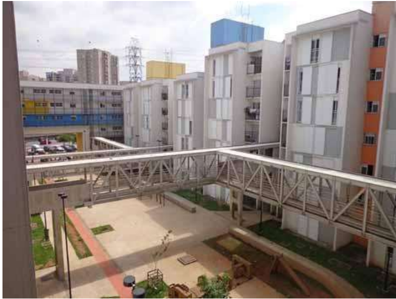
Figura 10. Conjunto Habitacional realizado pela SEHAB de São Paulo, com projeto de Biselli e Katchborian arquitetos