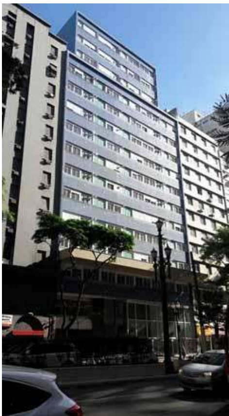
Figura 3. Edifício Dandara

Nota: Convertido em edifício residencial, no ano de 2018, através de projeto da Assessoria Técnica Integra, para o Movimento de Moradia ULCM.