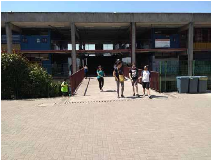
Figura 8. Centro de Educação Unificada, no Jardim Paraná, zona norte da cidade de São Paulo

Nota: Edifícios escolares associados a teatro e clube abertos à comunidade do entorno, configuram uma centralidade e uma possibilidade outra para os bairros populares com muitas precariedades onde são instalados.