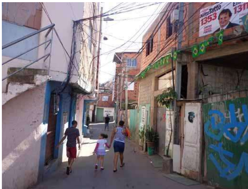
Figura 7. Favela na zona sul de São Paulo