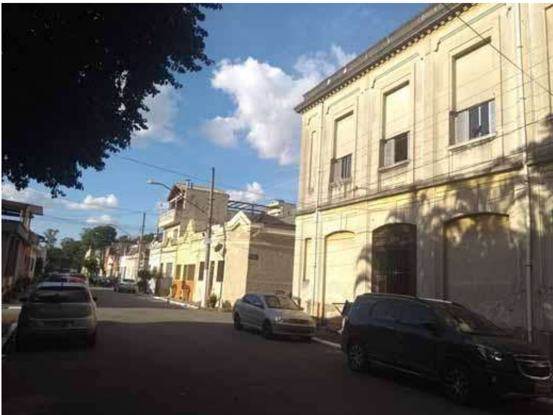
Figura 1. Foto recente da Vila Maria Zélia, inaugurada em 1917 na margem esquerda do rio Tietê, próximo à indústria propriedade da família Street