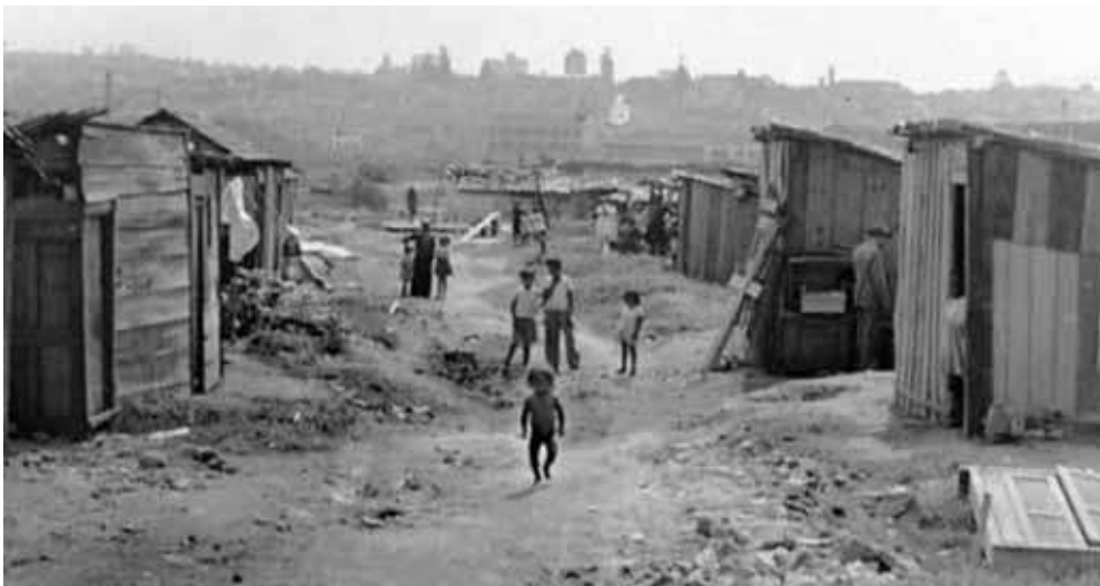
Figura 2. Favela do Ibirapuera, removida aquando da construção do parque no 4º centenário da cidade, em 1954