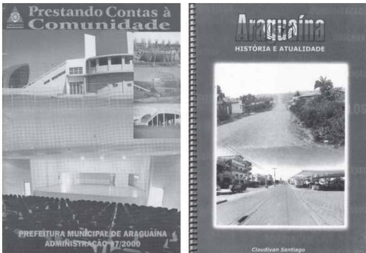
Figura 2. Capas das Revistas foco da análise

Fonte: Capa da Revista institucional “Prestando Contas à Comunidade” (2000), à esquerda; Capa da Revista “Araguaína – História e Atualidade” (2000), à direita. Acervo dos autores.