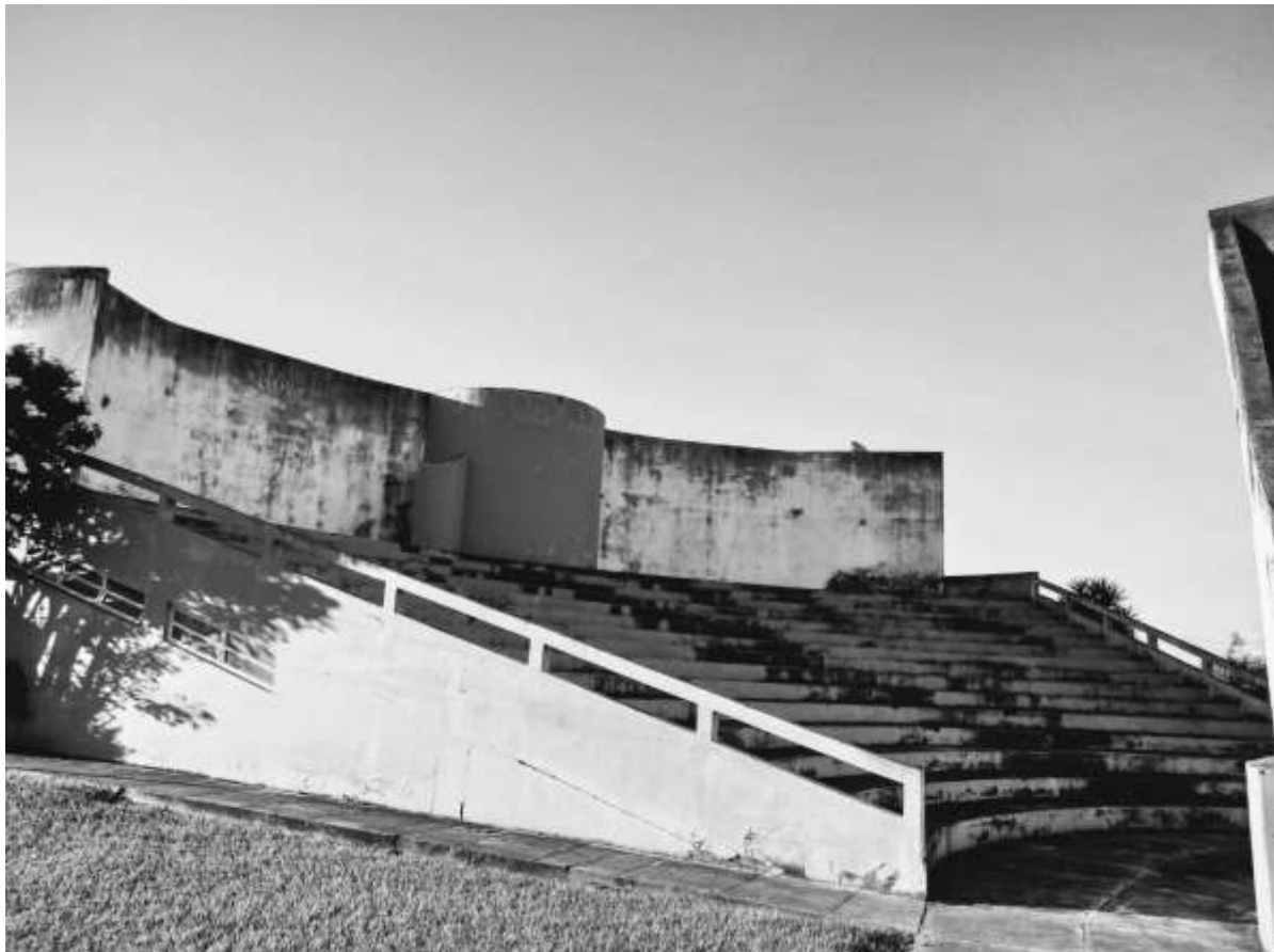
Figura 1. O Espaço Cultural Agnaldo Borges Pinto

Por meio da Figura 1, apresentamos, a seguir, uma fotografia de nosso acervo pessoal, com a visão da escadaria reservada ao público em momentos de espetáculo: