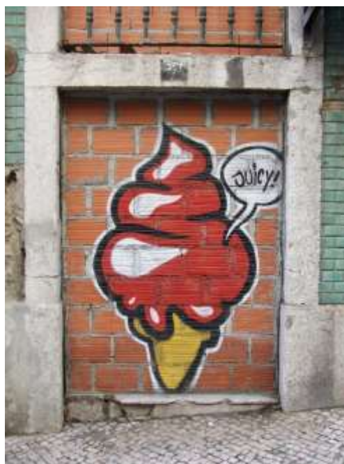
Figura 6. Graffiti (Lisboa).