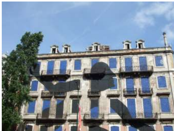
Figura 4. Arte Urbana comissionada (projecto Crono) – Lisboa.

prática dos graffiti-writers se destina essencialmente ao reconhecimento interno (entre os pares), verificamos que o público a que se destina a street art é bem mais alargado.