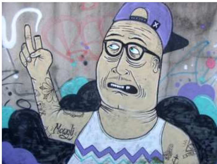
Figura 3. Graffiti pictórico (Lisboa).