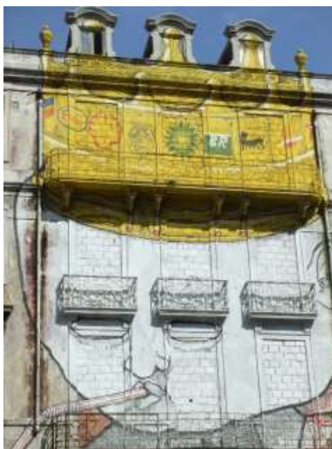
Figura 8. Arte Urbana comissionada (Projecto Crono) (Lisboa).