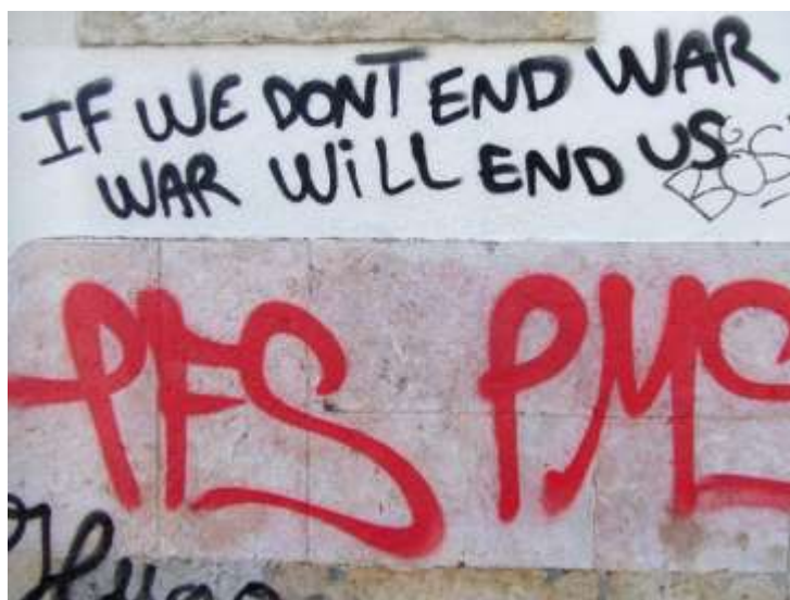
Figura 2. graffiti verbal, escritos (Lisboa).