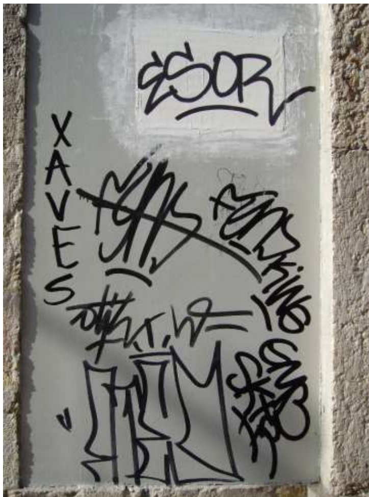
Figura 1. Graffiti verbal, tags (Lisboa).