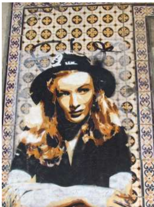
Figura 5. Arte Urbana não comissionada – Lisboa.