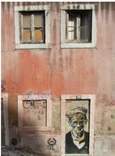
Figura 7. Arte Urbana não comissionada - Stencil (Lisboa).