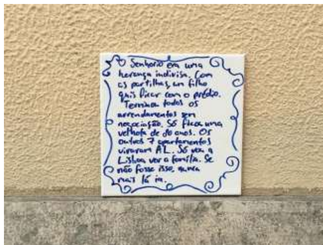
Figura 2. Projeto “Perdi a Casa” – Festival HabitACÇÃO, Lisboa, 2019