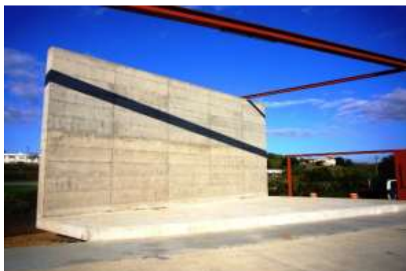
Figura 7. Detalhe da parte traseira do painel e que forma um palco a céu aberto para realização de eventos