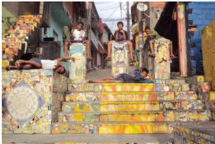
Figura 16. Escadaria Mocidade Alegre, Vila St.ª Inês, Zona Leste de São Paulo, 2011