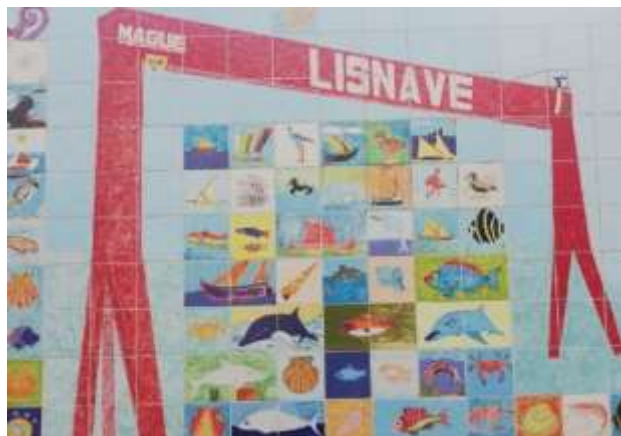
Figura 11. Detalhe do painel, Cova da Piedade, Almada