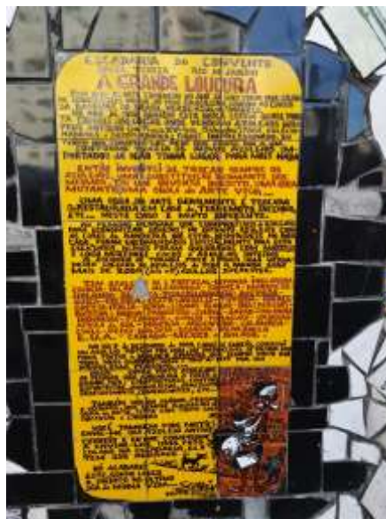
Figura 14. Painel descritivo do processo de cocriação da Escadaria Selarón, segundo o artista