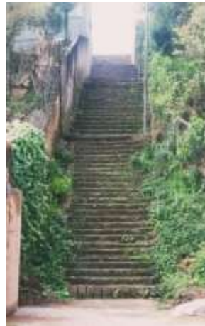
Figura 17. Escadaria Jardim Carvalho - Antes da intervenção cocriativa, Porto Alegre