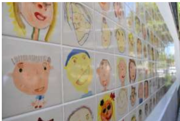
Figura 3. Projeto “Eu, nós e os outros”, Benfica, Lisboa, 2016