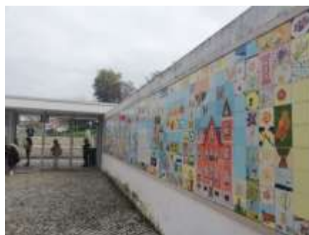
Figura 10. Espaço público em frente a escola com painel ao fundo, Cova da Piedade, Almada

Em Almada, nomeadamente na Cova da Piedade, tive mais recentemente conhecimento do painel em azulejo, realizado entre 2008 e 2009, que cobre o muro de entrada da Escola 2/3 Comandante Conceição e Silva. Até o momento, as referências que encontrei a este painel aparecem de modo pontual em agendas culturais do Município de Almada e num Blog sobre viagens. Em todo o caso, o painel é particularmente interessante, sendo de destacar pelos seguintes motivos: é um elemento de revitalização do espaço público à frente da escola (Figura 10), resulta de um trabalho colaborativo e cocriativo entre alunos, professores e funcionários da escola, e representa as principais referências do património e da memória da Cova da Piedade e de Almada (Figura 11).