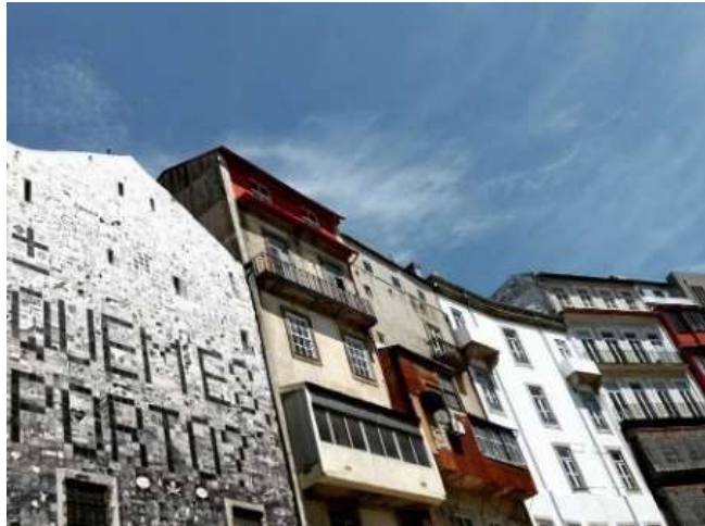
Figura 1. Projeto “Quem és Porto”, Porto, 2017