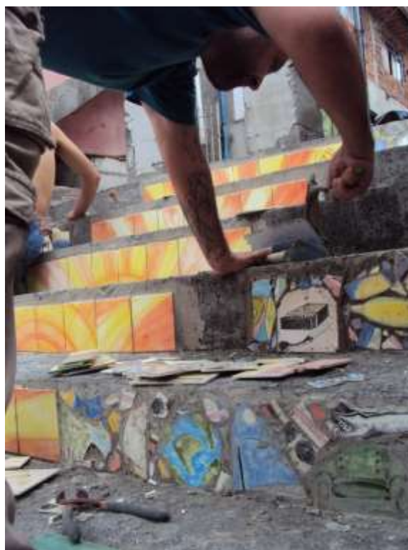
Figura 15. Escadaria Mocidade Alegre, Vila St.ª Inês, Zona Leste de São Paulo, 2011