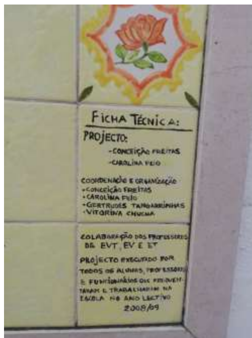
Figura 12. Ficha técnica do painel e explicação da autoria partilhada, Cova da Piedade, Almada