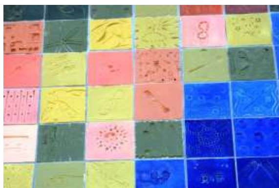
Figura 9. Detalhes dos azulejos do painel