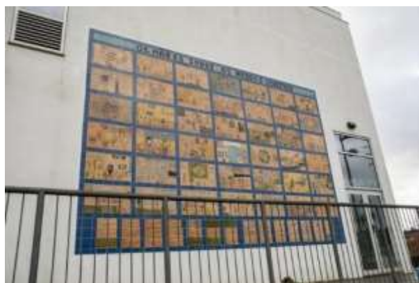
Figura 4. Centro Escolar de Gilmonde, Barcelos, 2019