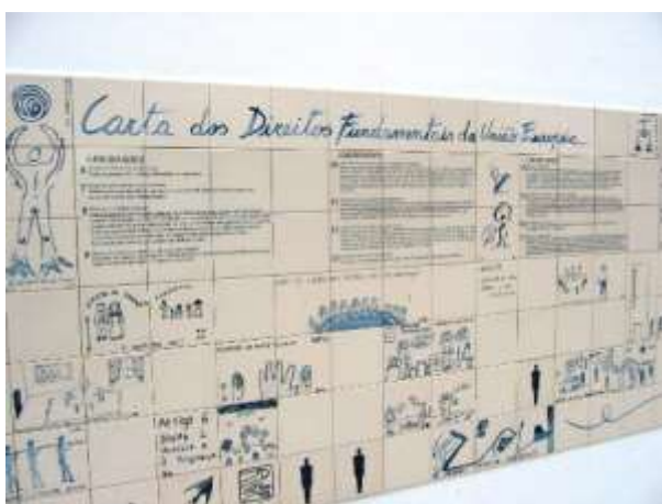
Figura 5. Imagem do painel concretizado em Serpa

9