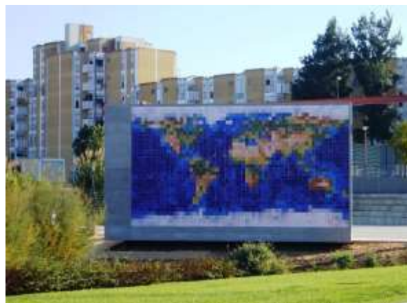
Figura 6. Painel Planisfério da Interculturalidade, tendo ao fundo o Bairro Amarelo, Monte da Caparica - Almada

Fonte: Imagem de Eva Maria Blum (14.10.2015).