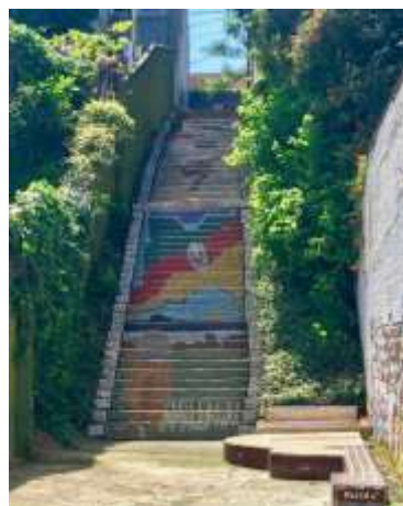
Figura 18. Escadaria Jardim Carvalho - depois da intervenção cocriativa, Porto Alegre