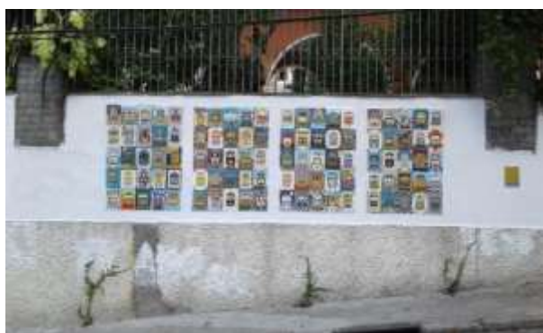
Figura 21. Enquadramento do Mosaico Bondinho de Santa Tereza em muro sito na Rua Paschoal Carlos Magno, Rio de Janeiro