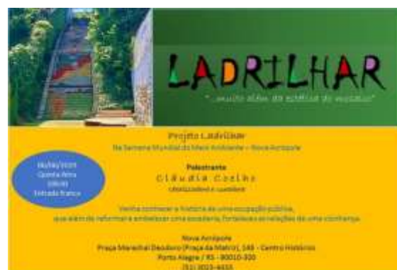
Figura 19. Cartaz de divulgação de palestra sobre o Projeto Ladrilhar