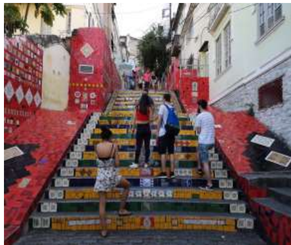
Figura 13. Escadaria Selarón, Bairro de Santa Teresa, Rio de Janeiro