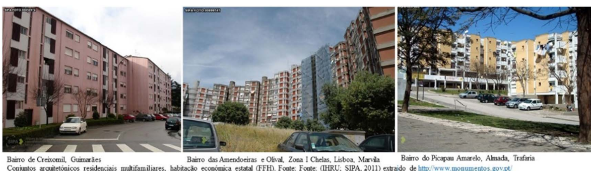
Figura 1. Três exemplos de conjuntos multifamiliares de habitação económica do FFH

Estes conjuntos habitacionais têm entre 4 e 5 décadas de existência. Por conseguinte, serviram de residência a pelo menos 4 gerações e são sobretudo constituídos por edifícios multifamiliares (tabela 1). Os casos em que predominam as moradias ocorrem em concelhos de baixa densidade.