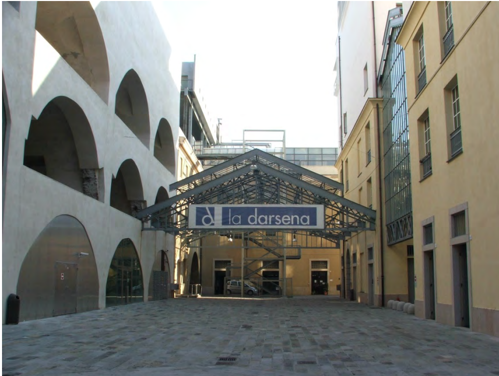
Figura 5. À direita, acesso à Faculdade de Economia e Comércio instalada em antigos galpões. Projeto de adaptação do arquiteto italiano Aldo Rizzo.