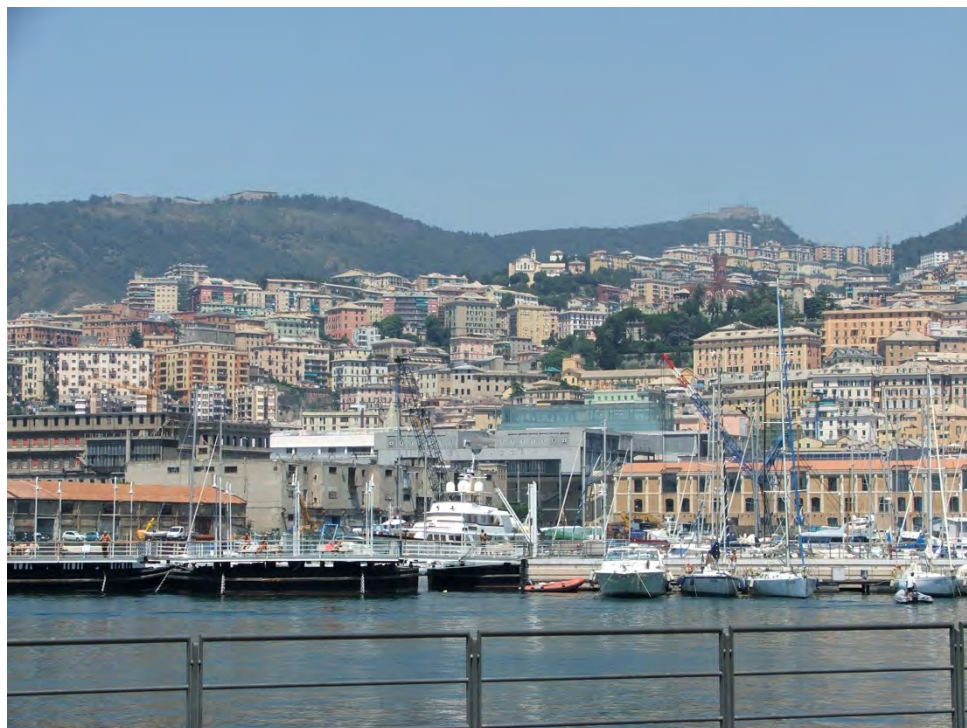
Figura 1. O porto de Gênova e a cidade histórica.