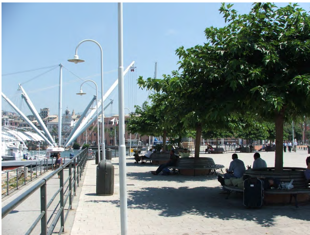
Figura 3. Vista geral do porto. Espaços públicos criados na Expo 92.

A primeira etapa do projeto de intervenção, a requalificação do porto antigo, foi confiada ao arquiteto genovês Renzo Piano. O projeto compreendeu uma área de 13 hectares e incluiu a maior parte do porto medieval e sucessivas alterações dos séculos XVI ao XIX (Figura 3). Inicialmente, foram construídos apenas dois edifícios novos: o Aquário e um bloco de serviços ao lado do antigo Armazém do Algodão, que foi adaptado para novo uso: salas expositivas, centro de convenções e outros serviços (Figura 4) 3 . Além dos novos edifícios, as áreas envoltórias foram trabalhadas em projeto paisagístico com a criação de amplos espaços públicos e equipamentos de serviços e lazer.