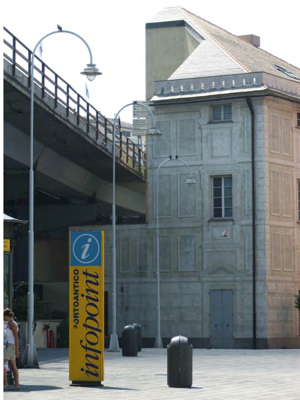
Figura 9. Antigos armazéns cortados pela via elevada.