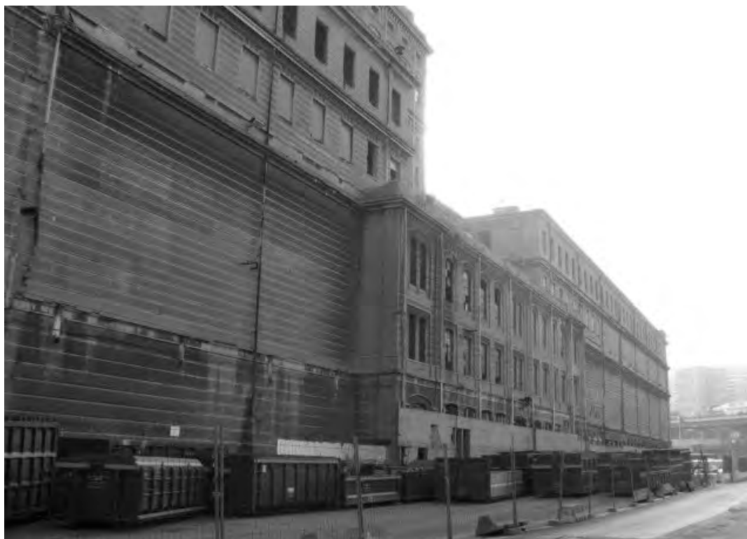
Figura 7. Silos de concreto armado atribuídos a François Hennebique.

Dentre os edifícios abandonados cujas particularidades formais e estruturais dificultam a escolha de um novo uso compatível, destacam-se os silos construídos em concreto armado, segundo projeto atribuído ao engenheiro francês François Hennebique (1841-1921), talvez o primeiro edifício construído nesse sistema na Itália (Figura 7). Na década de 1990, cogitou-se recuperar os enormes silos para abrigar um hotel (Poleggi, 1991:14) e, no início dos anos 2000, surgiu a proposta de instalar ali a Faculdade de Engenharia, projeto que estaria a cargo de Rem Koolhaas e Stefano Boeri (Gabrielli, 2005:35). Atualmente o edifício está abandonado.