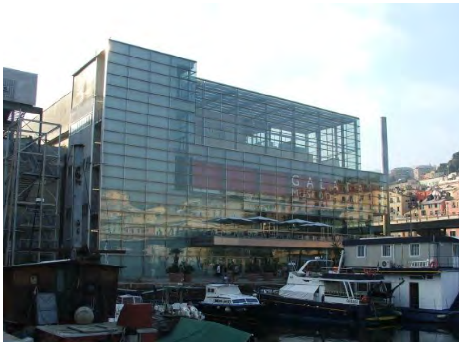
Figura 6. Museu do Mar e da Navegação, construído em um antigo estaleiro segundo projeto do arquiteto espanhol Guillermo Vázquez Consuegra.