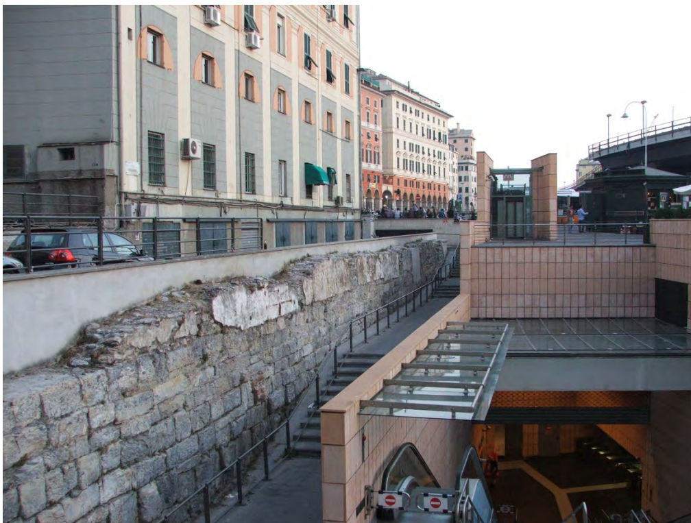
Figura 8. Entrada da Estação San Giorgio. Parte da estrutura de pedra das antigas plataformas portuárias foi deixada à vista.

Além da ruptura na paisagem, durante a construção da via elevada, armazéns portuários datados dos séculos XVII e XVIII foram parcialmente cortados (Figura 9). De maneira análoga, a construção do túnel e do sistema metroviário, na década de 1990, condenou as antigas estruturas portuárias que vieram à tona durante as escavações para realização das obras. Tratava-se das estruturas do sistema portuário medieval composto por plataformas de pedra e que ficara escondido sobre as sucessivas estratificações advindas das modernizações posteriores. As estruturas estavam intactas no subsolo e foram retiradas para a passagem do metropolitano, restando apenas uma parede que hoje está à mostra na entrada da estação (Figura 8). O sistema representava um testemunho único de arqueologia industrial e acabou sendo removido sem gerar muita discussão 6 .