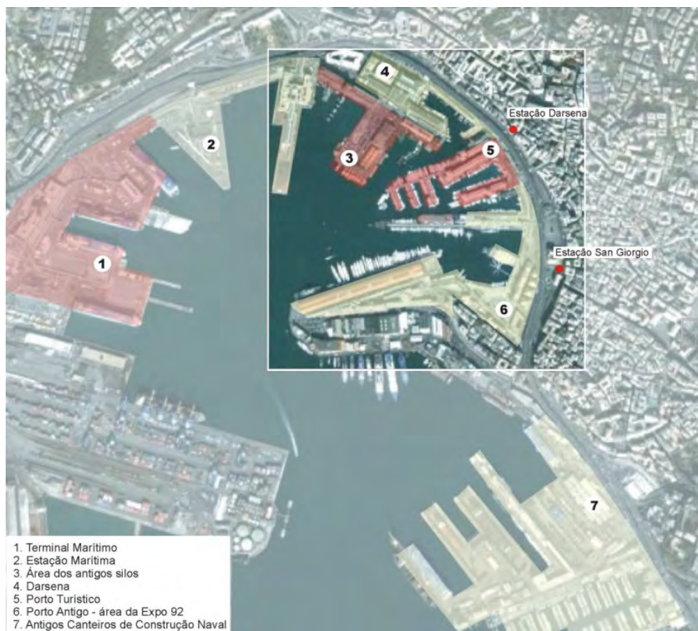
Figura 2. Porto histórico de Gênova. Em destaque, área onde se concentram os principais projetos de revitalização já executados ou em andamento (sem escala).

Por muito tempo o porto de Gênova assumiu a posição de principal porto italiano e as atividades industriais sediadas na cidade – muitas delas associadas às funções portuárias, a exemplo dos setores da produção naval e da siderurgia –, conferiam a Gênova um lugar de destaque entre os maiores centros industriais do país. Tanto as atividades portuárias, quanto as industriais, no entanto, começaram a entrar em declínio entre os anos 1960 e 1970. O porto não acompanhou as adaptações tecnológicas necessárias e tornou-se obsoleto. No final da década de 1980, com a reestruturação do Consórcio Portuário como sociedade público-privada e a reorganização de serviços e construção de novos terminais, o porto começou a buscar sua reinserção funcional, mas muitas das antigas estruturas ainda precisavam ser readaptadas para corresponder às novas atividades. A Expo 92, portanto, seria uma oportunidade para alavancar projetos de requalificação que já vinham sendo pensados.