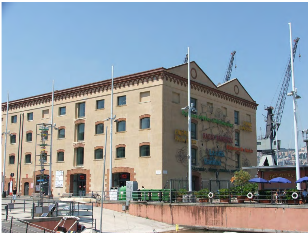
Figura 4. Antigo Armazém do Algodão: adaptado para espaços culturais e comerciais.