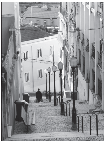
@ Pedro Corte-Real