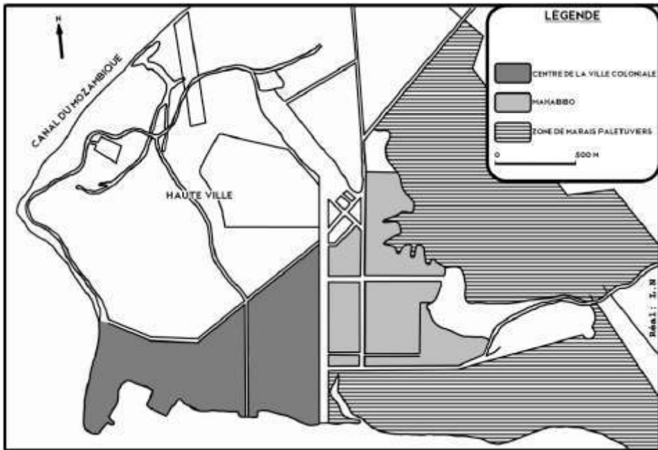
Carte de Majunga dans les années 1930-1940

de main-d'œuvre pour le port et les chemins de fer, ou de domestiques, la population africaine afflue rapidement des environs ou de régions plus lointaines.