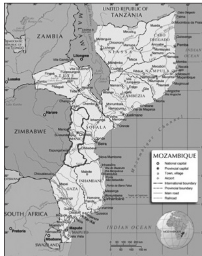
Mapa 1: Província de Manica (Nations Online Project)

Na fronteira entre Moçambique e o Zimbabué encontra-se Mossurize, um distrito moçambicano pertencente à província de Manica e que se situa na parte Sul desta linha de fronteira. A sua capital é Espungabera e os territórios limítrofes são o distrito de Sussundega (a Norte), o distrito de Machaze (a Sul), o distrito de Chibabava (a Leste) e o Zimbabué (a Ocidente). A sua população pertence ao grupo étnico ndau .