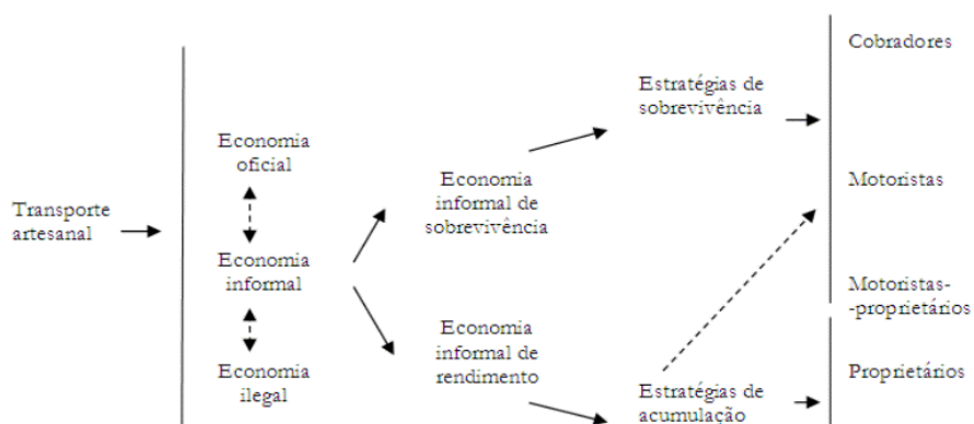
Figura 2 – Estratégias dos actores

A possibilidade de percursos de mobilidade social descendente é muito real no quadro da actividade dos candongueiros em Luanda, uma vez que se trata