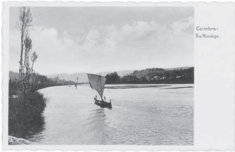
Fig. 1 – Rio Mondego (Edição da Comissão de Turismo, Coimbra). Fig. 1 – Mondego River.

Apresentam-se a seguir exemplos significativos da colecção (figs. 1-8).