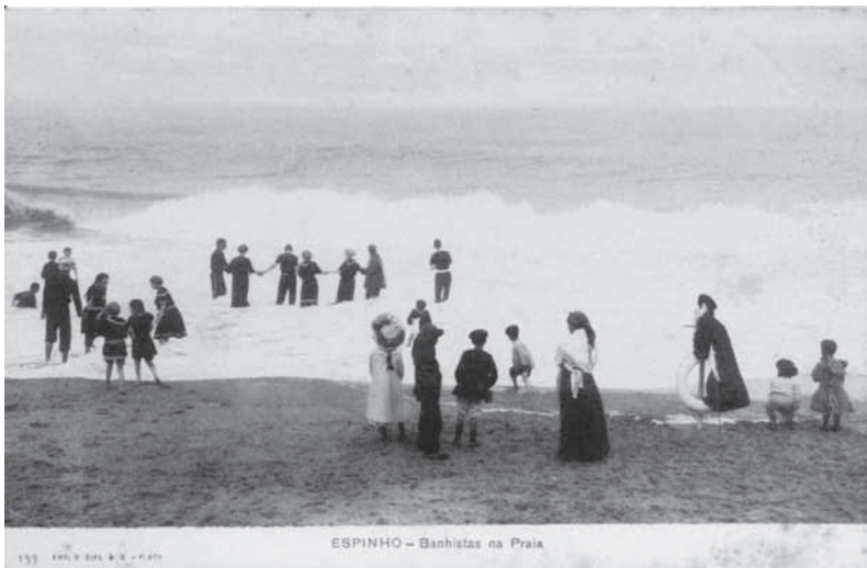
Fig. 2 – Espinho. Banhistas na Praia (Emílio Biel, Porto). Fig. 2 – On the beach.