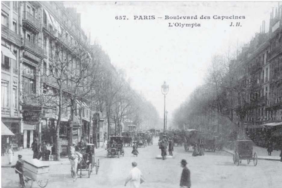
Fig. 6 – Paris. Boulevard des Capucines (J. H.).