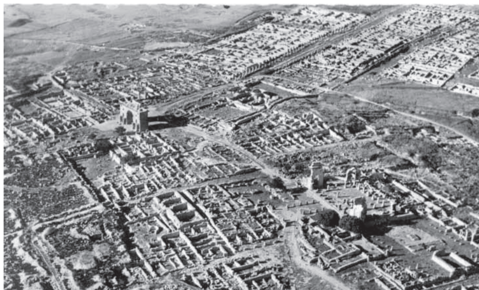
Fig. 5 – Volubilis. Vista aérea das ruínas. Fig. 5 – Aerial view of the ruins.