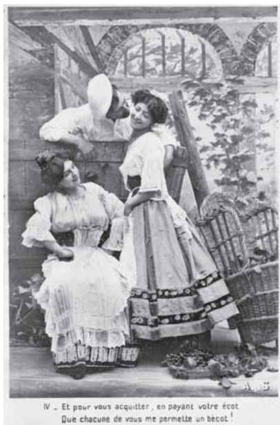
Fig. 4 – Os namorados (Edições Geschützt). Fig. 4 – The lovers.