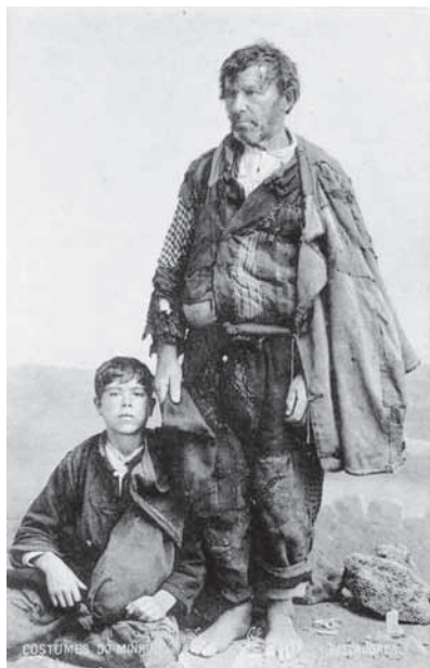
Fig. 3 – Pescadores (Edição do Bazar Couto Viana, Viana do Castelo). Fig. 3 – Fishermen.