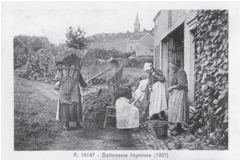
Fig. 7 – Camponesas belgas em 1921. Fig. 7 – Belgian country women.