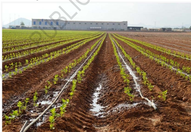
Fig. 3 – Superficie de cultivos hortícolas con tecnología de riego por goteo (Campo de Cartagena, Región de Murcia). Figura en color disponible en línea.

A nivel institucional, la Confederación Hidrográfica del río Segura es también un ejemplo paradigmático, dentro de la realidad española. Apoyándose en la labor del Instituto Murciano de Investigación y Desarrollo Agrario y Alimentario (IMIDA), se cuenta con la tecnología Drone2Map for ArcGIS (ESRI), que es una aplicación que convierte las imágenes de los drones en ortomosaicos y mallas 3D. Esta generación de cartografía permite llevar a cabo un seguimiento temporal de la cantidad de agua que se dispone en las diferentes partes de las cuencas.