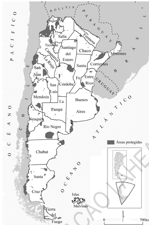
Fig. 1 – Áreas protegidas de Argentina.