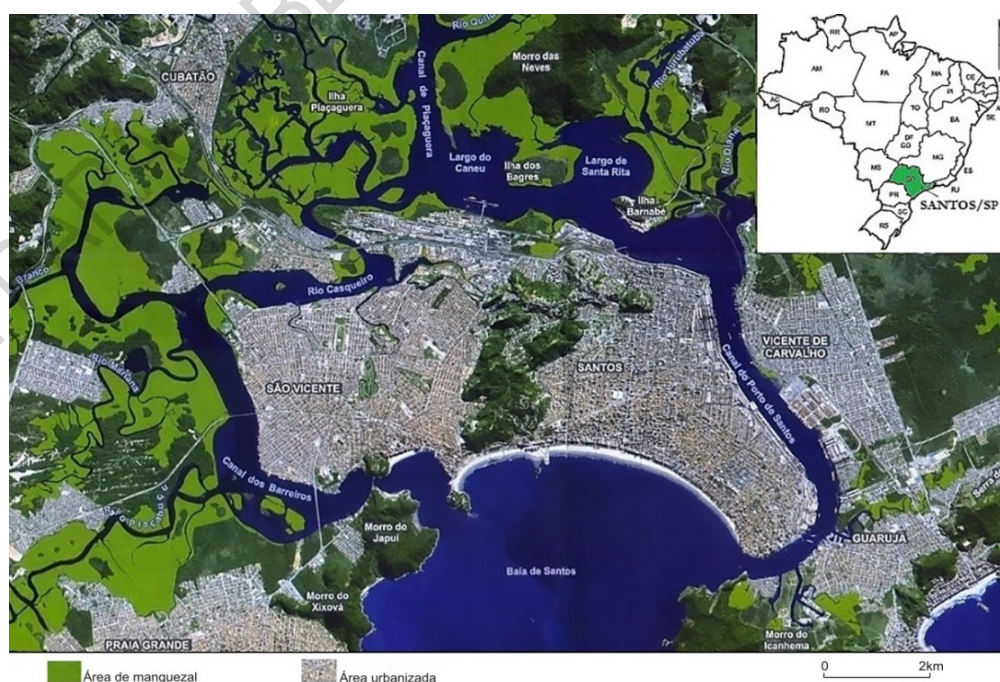
Fig. 2 – Canal do Porto de Santos e área envolvente. Figura a cores disponível online.

O município de Santos é extremamente urbanizado (fig. 2), com comunidades instaladas por todo o entorno da área portuária. As obras de ampliação do Porto de Santos requerem o remanejamento das comunidades, que já sofrem cotidianamente com a logística de transporte de cargas, geração de resíduos, poluição sonora, etc. O processo de ocupação das áreas periféricas municipais é recorrente, principalmente considerando o elevado custo de vida e habitação, que acompanham baixos índices de qualidade de vida (e.g., moradia e saúde). Tais comunidades situadas no entorno da área portuária (de maior movimentação e atividade) também estão mais expostas ao risco de acidentes, e contam com apenas uma base principal do Corpo de Bombeiros localizada na parte central do município, onde a mobilidade é reduzida devido à densidade do tráfego urbano. O acesso a hospitais e casas de saúde partindo das comunidades do entorno dos terminais de granéis líquidos também é dificultado pelo trânsito. Tais situações representam fatores críticos no caso de acidentes oriundos das atividades do porto. A extensão da área de manguezal está majoritariamente localizada próxima aos terminais de granéis líquidos operantes no Porto de Santos, aumentando a sua exposição aos acidentes com impactos ambientais negativos, como foi o caso do incêndio ocorrido no terminal da Ultracargo, no ano de 2015.