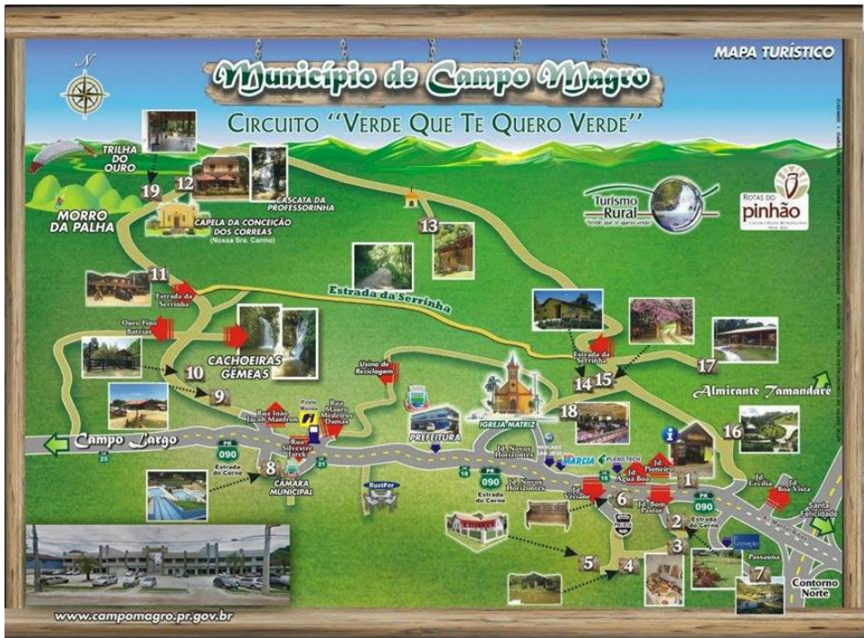
Fig. 2 – Roteiro de turismo rural 'Verde Que te Quero Verde' de Campo Magro. Figura a cores disponível online.