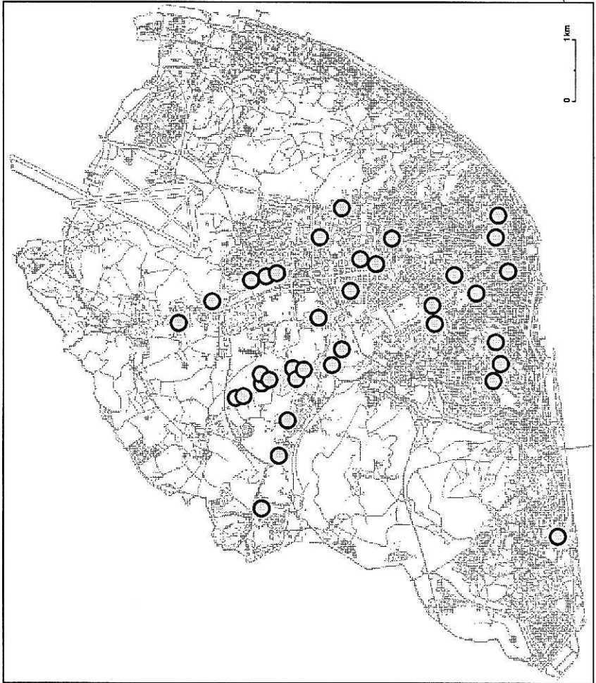
Figura 1 – Oferta de apartamentos de luxo em Lisboa.