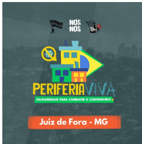
Fig. 1 – Logo da Campanha “Periferia Viva”. Figura a cores disponível online.

A principal ação desenvolvida na campanha, cujo logo se pode ver na figura 1, é a doação de cestas contendo alimentos, máscaras e materiais de higiene e limpeza, mas atividades pontuais também são realizadas.