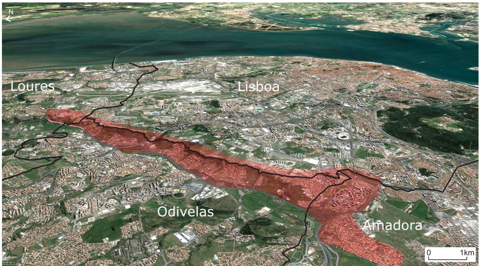
Fig. 2 – Localização da Costeira de Loures. Figura a cores disponível online.

A área de estudo, na Costeira de Loures, estende-se da parte leste do bairro da Brandoa (Amadora) à Ponta da Agueira (Loures) (fig. 2). É uma unidade morfológica de relevos estruturais monoclinais, geologicamente instável. A ocupação, de génese ilegal, evoluiu no sentido descendente, do planalto (Lisboa) até ao sopé da costeira, apoiada numa rede viária incipiente. As características morfológicas (que vão desde os declives acentuados nas cotas mais elevadas até zonas inundáveis nas margens das ribeiras) e geológicas não são propícias à ocupação urbana, por induzirem riscos naturais (instabilidade de vertentes, deslizamentos de terras, cheias rápidas) agravados pela ação antrópica (progressiva sobrecarga e impermeabilização do solo; alterações nos cursos de água por barreiras e estrangulamentos).