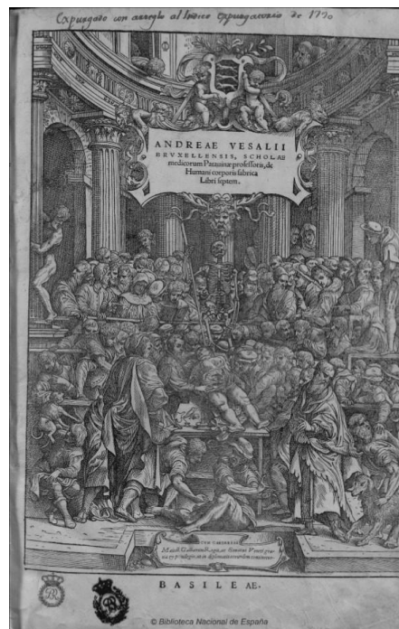
Figura 3 - Andrea Vesalio, De humani corporis fabrica Libri Septem (frontispicio de la obra), 1543, Basilea, Ex Officina Ioannis Oporini.

Los estudios anatómicos de Leonardo alcanzaron un nivel de precisión descriptiva mayor que cualquiera de las imágenes utilizadas por los profesionales de la anatomía en esa época, pero su impacto sobre otros pintores y anatomistas coetáneos fue bastante limitado, principalmente porque eran manuscritos. Como se ha comentado con anterioridad, mediado el siglo XV la imprenta revolucionó el mercado del libro y permitió alcanzar una difusión sin precedentes a los textos y las imágenes; este hecho afectó decisivamente al desarrollo de las ciencias y de la anatomía, pues permitía que las publicaciones impresas llegaran a mayor número de lectores y, por ende, que los conocimientos contenidos en las mismas tuviesen mayor impacto y pudiesen ser replicados o refutados por otros autores. En este sentido, el año 1543 fue enormemente relevante, pues se publicaron De revolutionibus orbium coelestium de Nicolás Copérnico y el tratado anatómico De humani corporis fabrica libri septem de Andrea Vesalio, que causaron dos cambios culturales sin retorno. El primero rompió la cosmovisión geocéntrica ptolemaica y el segundo rompió la visión del cuerpo humano, poniendo en tela de juicio las ideas de Galeno, secularmente asumidas.