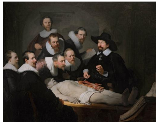
Figura 6 - Rembrandt van Rijn, Lección de anatomía del Doctor Nicoales Tulp , 1632. Óleo sobre lienzo, 169,5 x 216,5 cm, La Haya, Mauritshuis (Inv. nº 146).

En ese contexto, la disección iniciada por Tulp en el antebrazo se ha interpretado con la voluntad de equipararse con Vesalio, quien se autorretrató al principio de su Fabrica disecando un antebrazo y también con la significación moral que se daba desde la Antigüedad, siguiendo a Aristóteles, a la mano humana como instrumento del alma, frente al intelecto como forma de las formas (Schupbach, 1982; Nash, 2004). Precisamente, Rembrandt pintó otra lección de anatomía en 1656 – en este caso protagonizada por el Doctor Deijmar – donde muestra la disección del cráneo, sede del intelecto, y cuya plasmación visual guarda notables analogías con la estampa del cráneo abierto incluida en el tratado de Vesalio.