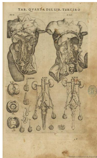
Figura 5 - Ilustración anatómica (Tab. Quarta del Lib. Tercero) incluida en el tratado de Juan Valverde de Hamusco, Historia de la composición del cuerpo humano , Roma, Impresa por Antonio de Salamanca y Antonio Lafréry. Esta estampa fue realizada con la técnica de grabado calcográfico sobre lámina de metal.

anatômicas del tratado, aunque se han barajado los nombres de Jan Stephen von Calcar, del escultor Jacopo Sansovino e, incluso, de Tiziano (Simons & Kornell, 2008; Laurenza, 2012). En cualquier caso, es indudable la gran calidad artística de las estampas, realizadas con la técnica de la entalladura o xilografía, consistente en labrar con una gubia un taco de madera, que luego se entintaba para trasladar al papel la imagen grabada en la matriz. Se menciona aquí la técnica precisa utilizada para realizar las imágenes anatómicas de Vesalio puesto que, a pesar de que a finales del siglo XV un artista como Alberto Durero había elevado la técnica de la entalladura a la categoría de “Arte” (en mayúsculas), las estampas realizadas con una matriz de madera daban como resultado, por lo general, imágenes conformadas por líneas más gruesas y mucho menos precisas. La técnica de grabado sobre lámina de cobre con buril, que experimentó un notable desarrollo en el siglo XVI, permitió obtener líneas y contornos más precisos y finos, y estos avances mejoraron la calidad de las imágenes anatómicas; un ejemplo de ello es la Historia de la composición del cuerpo humano (1556) del anatomista español Juan Valverde de Hamusco (figura 5).