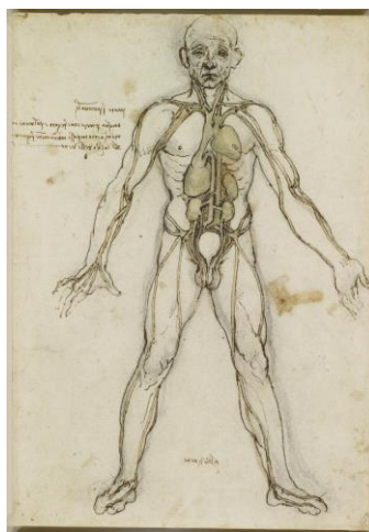
Figura 2 - Leonardo da Vinci, Los principales órganos y vasos sanguíneos del cuerpo humano , ca. 1485-1490. Dibujo a lápiz negro o carboncillo, pluma y tinta, aguada marrón y verde, 278 x 197 mm, The Royal Collection Trust (RCIN 912597).