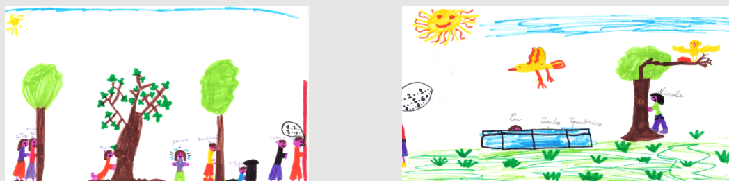
Figura 3 – Exemplos de desenhos das crianças

As crianças retrataram nos seus desenhos as árvores, as nuvens, os pássaros, o céu azul, o sol, a relva e o campo de futebol (Figura 3). Estes são os espaços preferidos pelos alunos, que representam com crianças a realizar as suas brincadeiras (exemplo: jogo de futebol, jogo das escondidas, entre outros).