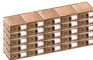
Figura 1 - Problema “Pilhas de caixas” (Mendes, Brocardo e Oliveira, 2012, p. 328)

Na mercearia da Piedade chegaram caixas de 24 maçãs cada como mostra a imagem. As 25 caixas chegaram e foram arrumadas em pilhas como é indicado na figura. No total das caixas, quantas maçãs há?