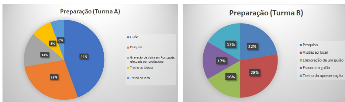
Figura 1 - Atividades de preparação da atividade

Por sua vez, a Turma B, destacou a importância das visitas ao local (28%) e da realização de pesquisas complementares no sentido de complementar a informação obtida aquando da visita ao local (22%). Foram ainda mencionadas estratégias como a elaboração de um guião (16%) e o estudo do guião no sentido de memorizar algum vocabulário específico (17%) e o treino da apresentação (17%) (ver Figura 1):