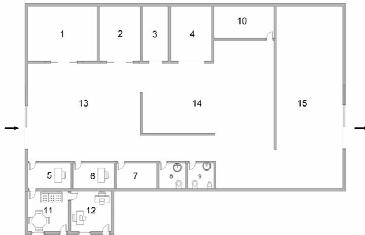
Figura 2 – Layout da indústria de produção de néctar.

Na Figura 2 apresenta-se o layout desenhado para a instalação industrial de produção de néctar de maçã e pera.