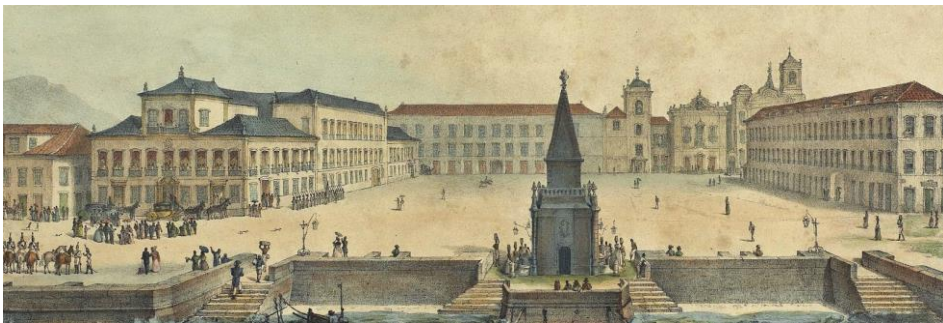
Imagem 3 – Rio Antigo - Cais do Largo do Paço – Chafariz do mestre Valentim.