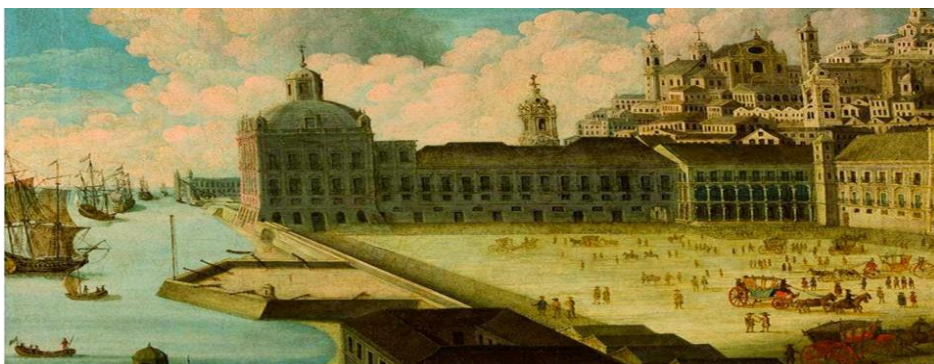
Imagem 4 – Porto Real de Lisboa – séculos XVIII e XIX - atual Terreiro do Paço. < http://marinhadeguerraportuguesa.blogspot.com.br/2014/03/o-porto-real-de-lisboa.html >.

Saindo da atmosfera do romance italiano, para adentrarmos novamente no romance do autor baiano, é lícito dizer que o cenário móvel também pode ser interessante de explorarmos. A bem da verdade, o palco encenado no romance A República dos Bugres aglutina questões coloniais bem interessantes e curiosas. Diante do exposto, os elementos móveis - carroças, transeuntes, animais, arruaceiros, escravos, vendedores ambulantes, que caracterizam e pulsam a vida nas cidades representadas, Salvador, Lisboa e Rio de Janeiro - também somam aspectos interessantes de serem examinados. Se, por um lado, esses elementos podem significar algo, substanciando esteticamente o lado mais exótico desses cenários, por outro lado, estão sempre modificando os seus detalhes. Subjugando esses apetrechos móveis, os pontos focais representados nessa tríade citadina nem sempre correspondem àquilo que o leitor busca averiguar na sua leitura. Como corrobora a historiadora Janice Theodoro: “A cidade colonial exclui a vegetação, não supõe o jardim, valoriza a pedra, casarios altos, próximos uns aos outros, de forma a delimitar com clareza o espaço da urbe, o espaço da cultura.” (Theodoro, 1992, p. 66).