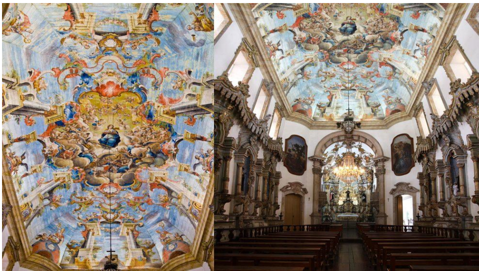
Imagem 6 – Interior da Igreja São Francisco de Assis – atual cidade de Ouro Preto-MG. < http://www.adrianofagundes.com/minas-gerais/ >.

frontispícios de igrejas, púlpitos com base de volutas, lavabos, chafarizes, coruchéus, capitéis, umbrais rendilhados, portadas, retábulos tarjados de ouro (...)” (Tapioca, 2008, p. 50).