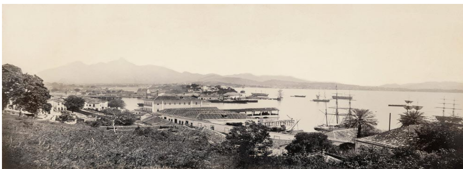
Imagem 5 – Panorama da Gâmboa, Rio de Janeiro, 1875. Georges Leuzinger/Acervo Instituto Moreira Salles. < http://www.faap.br/hotsites/panoramas/ >.

Conforme descreve o narrador, em terceira pessoa, as andanças das personagens Quincas e Jacinto Venâncio nas ruas da antiga cidade, em particular no bairro da Gâmboa, recuando ao ano de 1783: “Cruzaram as esquinas das ruas do Sabão e São Pedro, e foram em frente, com paradas aqui e ali, em direitura do Valongo, sempre pela Direita, a próxima a rua das Violas; a seguinte; a dos Pescadores (...).” (Tapioca, 1999, p. 104).