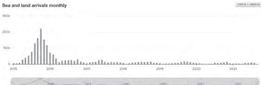
Figure 1 UNHCR Mediterranean Sea and land arrivals since 2015

Overall irregular border crossings to EU member states have dramatically decreased since Europe detected 1.82 million illegal external border crossings in 2015. According to UNHCR (2021) data, 95,031 refugees and migrants crossed the Mediterranean into the EU during 2020 and 64,394 as of August 29, 2021.