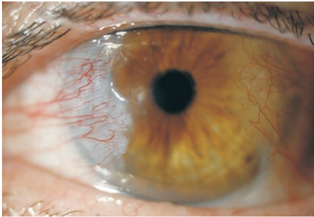
Fig. 1 | Recidiva de Pterígio.

com o mínimo de um ano de período pós-operatório.