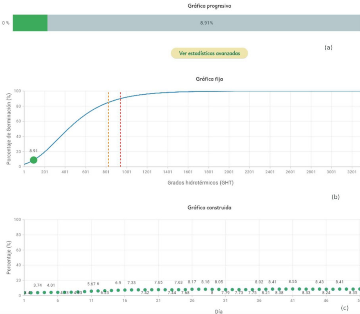
Figura 3 - a: Porcentaje de plantas emergidas en el momento actual; b: Evolución prevista de emergencias en función de los grados hidrotérmicos acumulados; c: Evolución prevista de emergencias desde la fecha de siembra.

del terreno. Una vez realizados estos tres pasos, se procesan los datos entrados, es decir, la aplicación provisiona las tareas automatizadas para procesar todos los datos asociados a la finca (meteorológicos, del campo, etc.), actuando el algoritmo de cálculo. Finalmente, tiene lugar la salida de la información, que consiste en mostrar el porcentaje de plantas emergidas en el momento actual (Figura 3a), la evolución prevista de las emergencias en función de los grados hidrotérmicos acumulados (Figura 3b) y la evolución prevista de emergencias desde la fecha de siembra (Figura 3c). Adicionalmente, la aplicación puede generar notificaciones a los usuarios si se supera un determinado umbral de emergencias predefinido por el usuario.