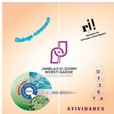
Figure 1. Young Researcher Window.