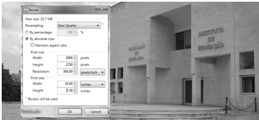
Figura [número]. Caption.

A figura deve surgir centrada na página. Por baixo da figura deve inserir a numeração e a caption, que deve ser uma explicação descritiva curta e deve incluir a fonte de onde foi retirada. Quando existir, a legenda deve fazer parte integrante da figura e deve estar na mesma língua do artigo. Um exemplo: