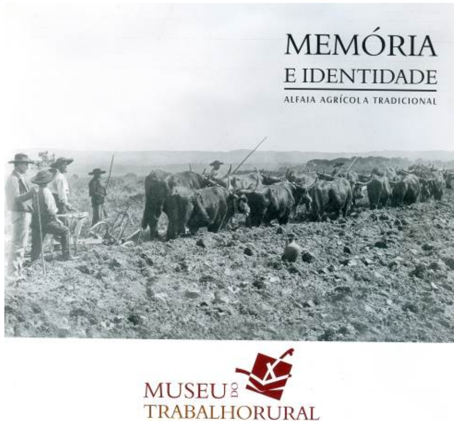
Figura 2. Capa do desdobrável do Museu do Trabalho Rural (2010). Reproduz uma fotografia de Hidalgo de Vilhena, pertencente ao arquivo da família Lobo de Vasconcellos.