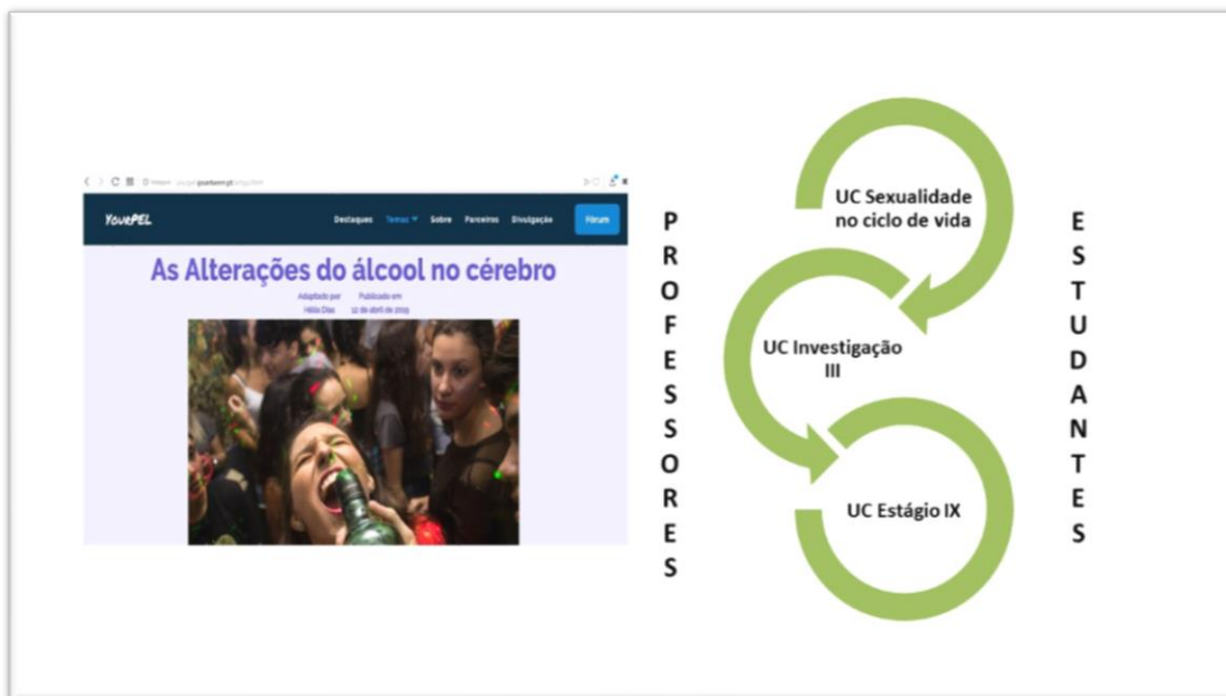
Figura 2 – Estratégia de produção de conteúdos para a Plataforma Your PEL

A produção dos conteúdos no âmbito das necessidades identificadas contou com a participação dos estudantes do Curso de Enfermagem do terceiro e quarto ano em diferentes unidades curriculares (Figura 2) e através de outras ferramentas sociais selecionadas para a intervenção.