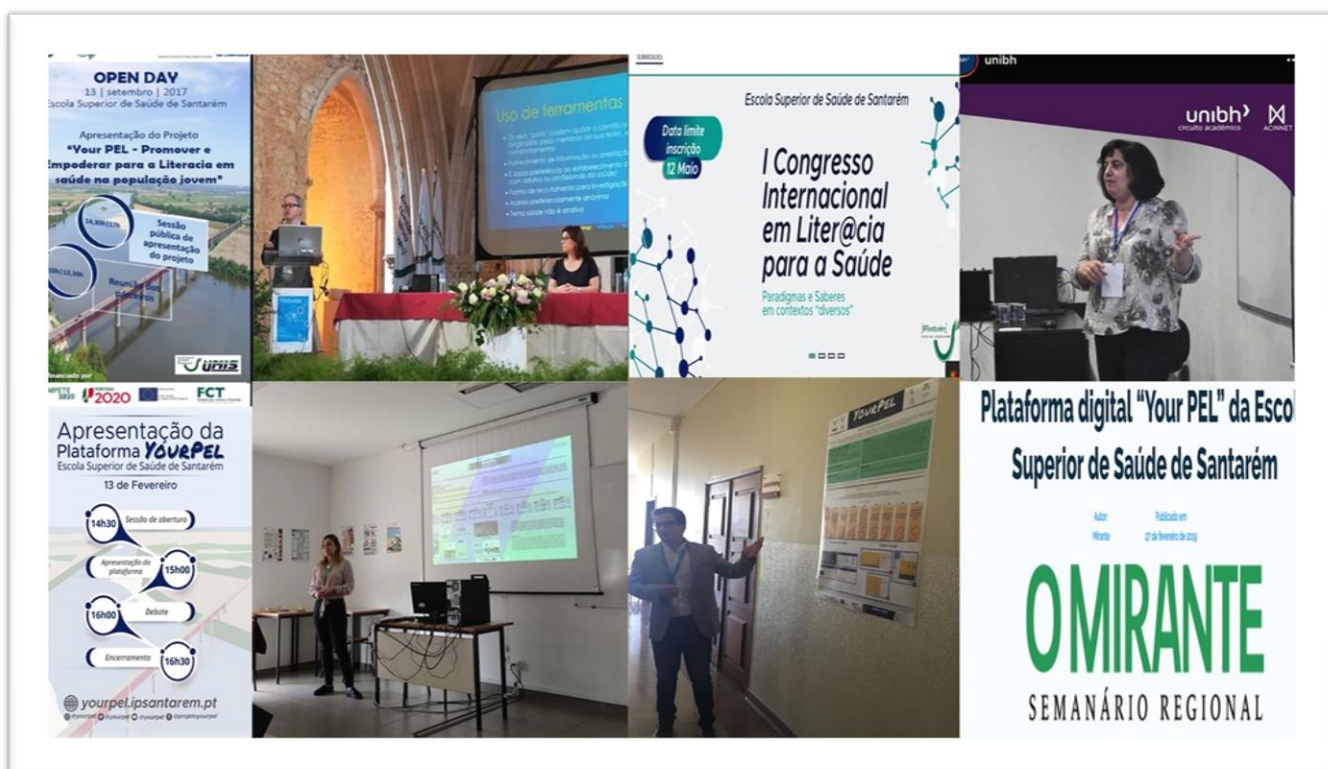
Figura 5 – Atividades de divulgação do Projeto Your PEL

Destaca-se o plano de divulgação dos resultados e disseminação do conhecimento, consonante com a abrangência territorial alargada e correspondendo aos domínios da saúde e das tecnologias aplicadas à saúde. Neste âmbito destacam-se várias comunicações orais, posters científicos e publicação de resumos em revistas científicas e a organização do Congresso Internacional em Literacia para a Saúde, com oradores nacionais e internacionais (figura 5).