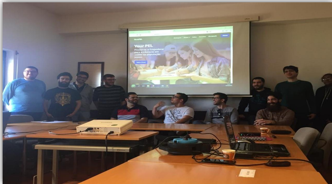
Figura 1 – Equipa tecnológica do Your PEL

A quarta atividade consistiu na programação da solução, envolvendo a equipa tecnológica (estudantes e professor), alargando-se a toda a equipa de investigadores nos testes e validação. A integração dos canais, de acordo com a tecnologia disponível pela plataforma adotada, foi da responsabilidade da equipa da Escola Superior de Gestão e Tecnologia, na unidade curricular “Integração de Sistemas II”, integrando o professor e onze estudantes do terceiro ano (Figura 1). O desenvolvimento de aplicações inovadoras em saúde constituiu-se numa ferramenta web , para as áreas da alimentação, sexualidade e consumo de tabaco e álcool, contribuindo para uma estratégia de aprendizagem, orientando os jovens na pesquisa de conteúdos fidedignos.